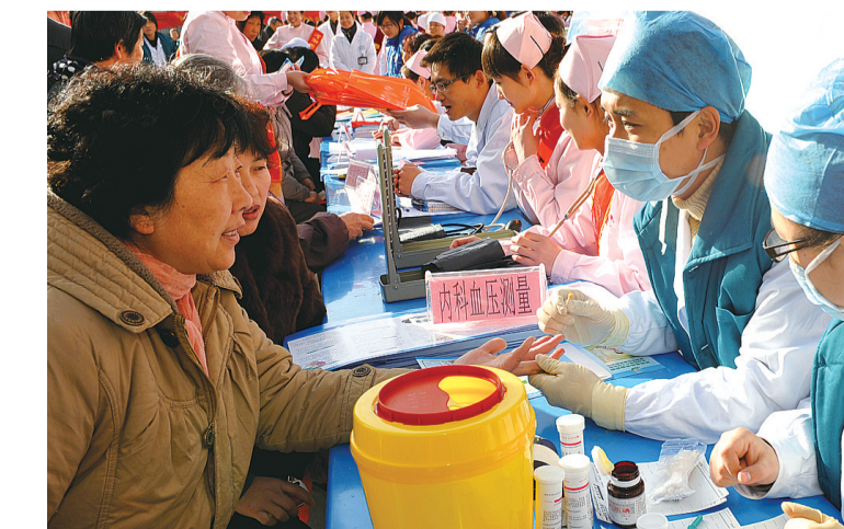
市六院医务人员走进社区开展义诊活动

12年前,郑州市结核病防治所除承担着各县(市)结核病防治工作的技术指导、督导检查和评价外,还