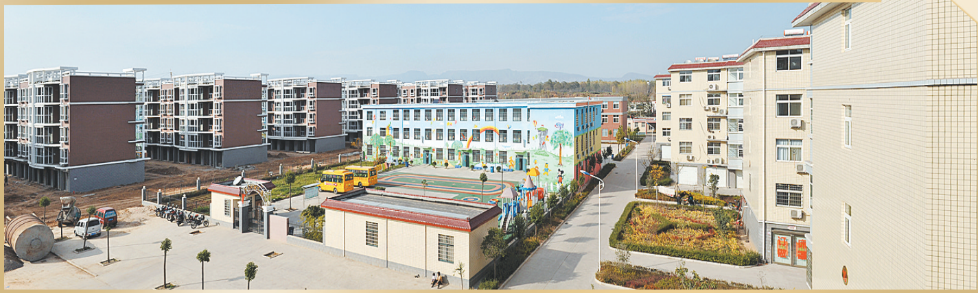
牛店镇张湾东宏社区