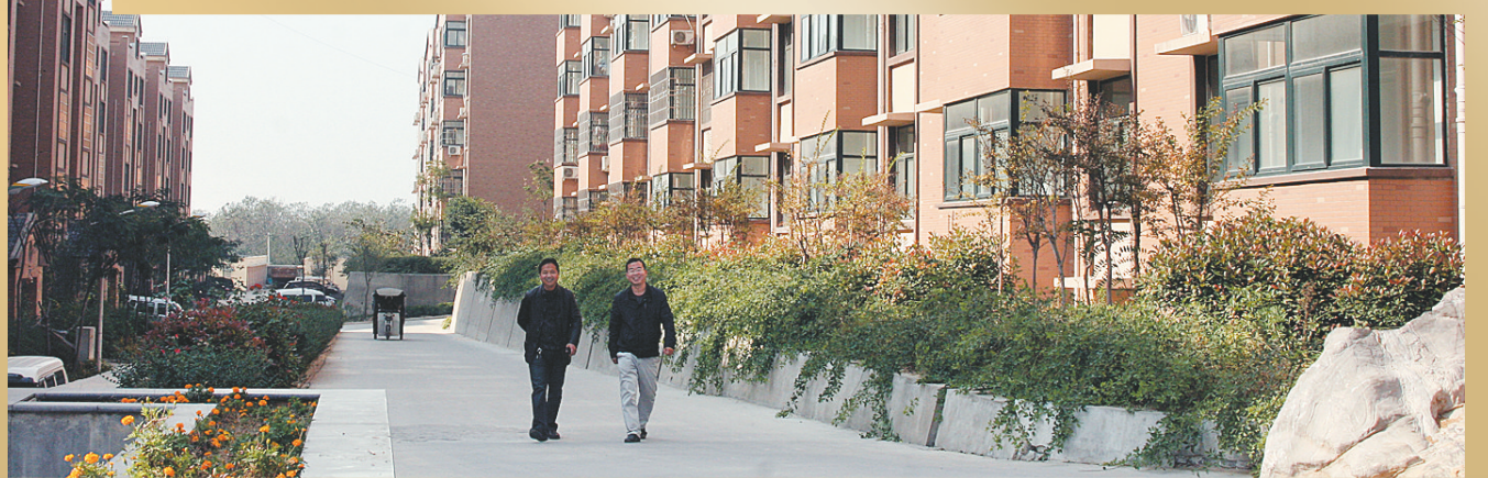
洞林湖社区环境优美