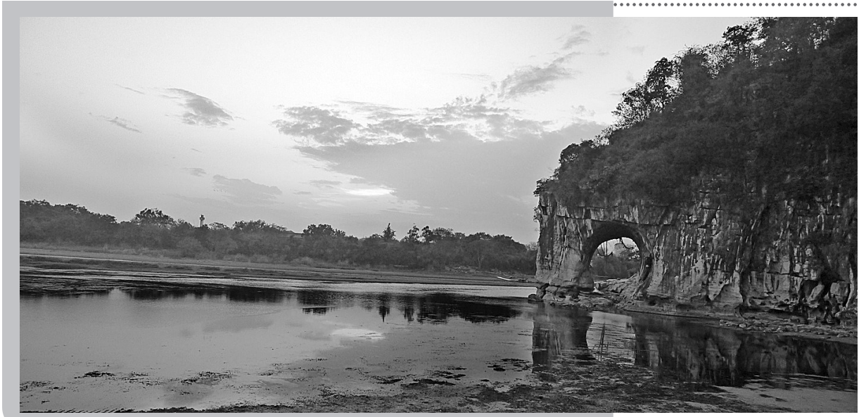
潢江象鼻山景色