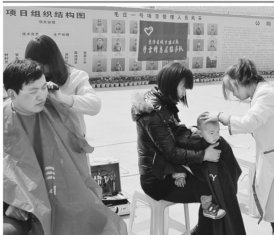
连日来,惠济区城乡建设局深入辖区工地,免费为农民工理发,并了解他们的生活情况,帮助他们解决实际困难。