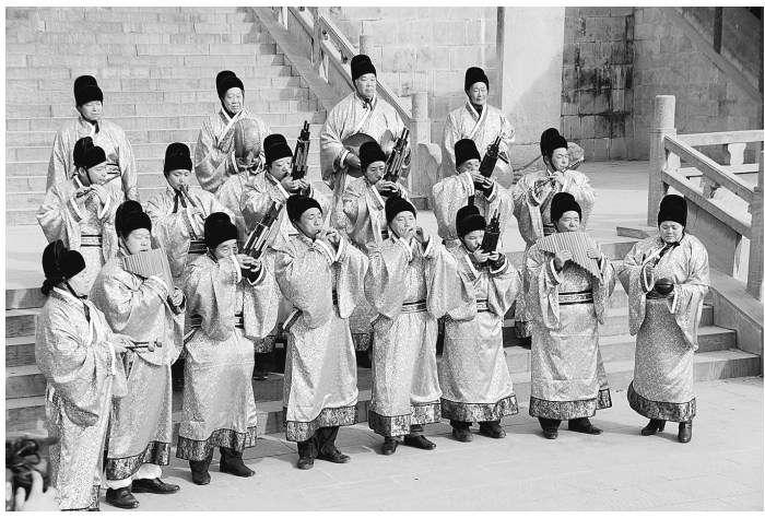
文明郑州·“非遗”名录

编辑 李昊 校对 刘桂珍 电话 67655592 Email: zzbzf@163.com