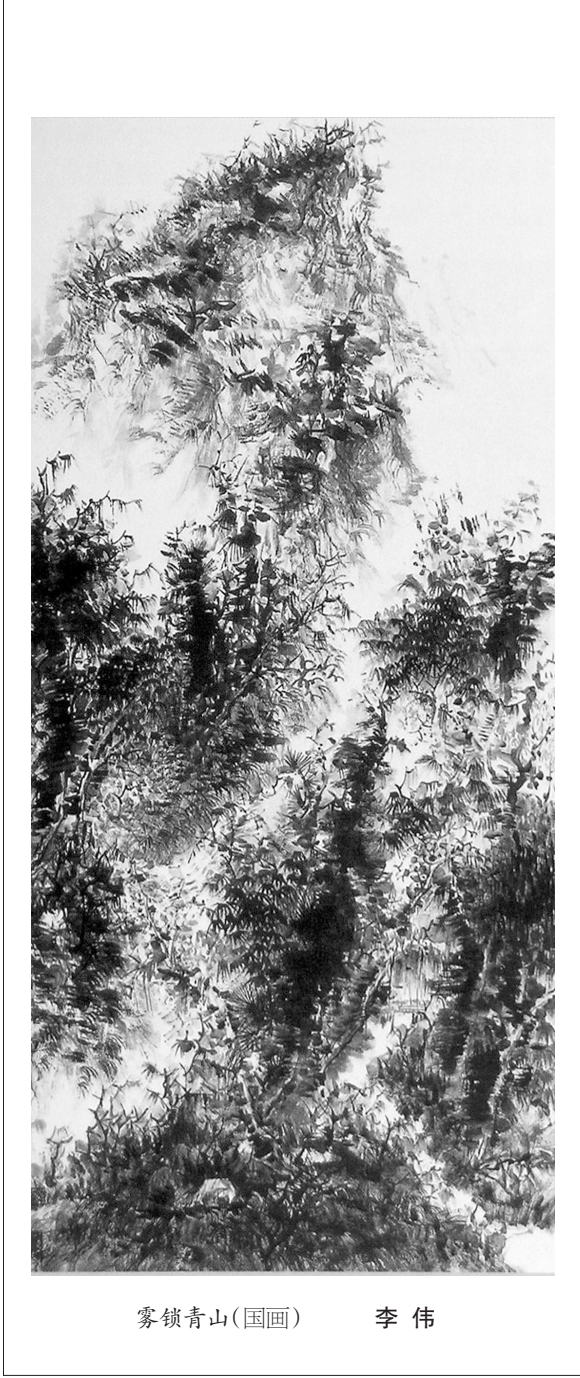
雾锁青山(国画) 李伟

无论是“胡先生豆腐”,还是“谭家菜”,都因了书家的缘故而闻名于世,真是“菜以人名”;这特殊的喜好,也促进了当地饮食文化的发展。