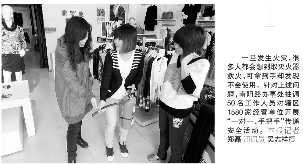
一旦发生火灾,很多人都会想到取灭火器救火,可拿到手却发现不会使用。针对上述问题,南阳路办事处抽调50名工作人员开展“一对一、手把手”传递安全活动。