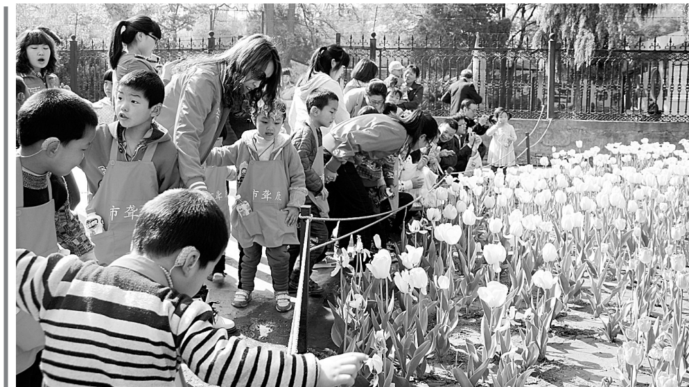
昨日,郑州市聋儿康复中心的孩子们来到市人民公园,在桃红柳绿、鸟语花香的如画美景中踏青游玩,尽情享受春天的美好时光。本报记者丁友明 通讯员董瑾 摄