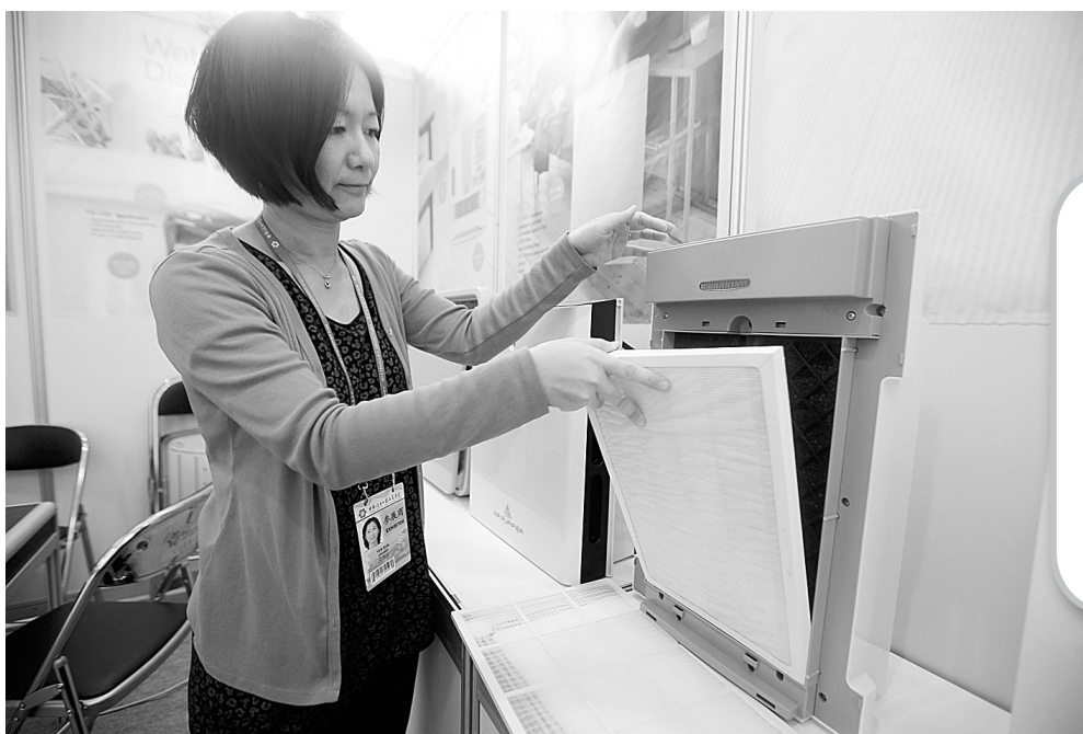
4月15日，第113届中国进出口商品交易会(广交会)在广州开幕。在本届广交会上，一些台湾企业带来的净化空气环保产品受到关注。

据悉，此次行动以无照经营印刷企业为重点查处对象，采取市场巡查结合群众举报的方式，对可疑地帯进行不间断的巡查，同时按照网格化管理区域划分，清查辖区内印刷经营主体资格，并把印刷台账制度作为监管检查的依据，督促印刷企业认真落实《印刷业管理条例》，按要求建立商标、广告印刷台账，严禁印制假冒农药、种子、化肥商标和虚假农资广告，从印刷源头防范不合格农资包装流入市场。