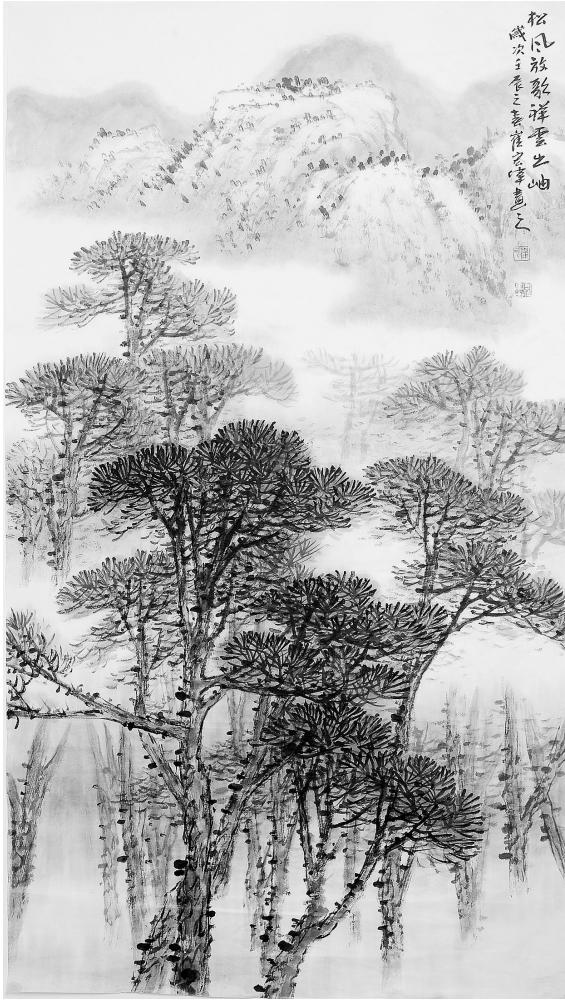
松风放歌 祥云出岫(国画)