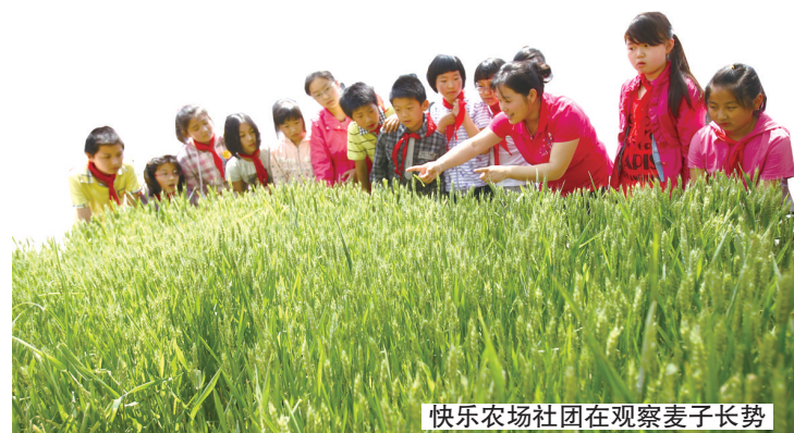
快乐农场社团在观察麦子长势