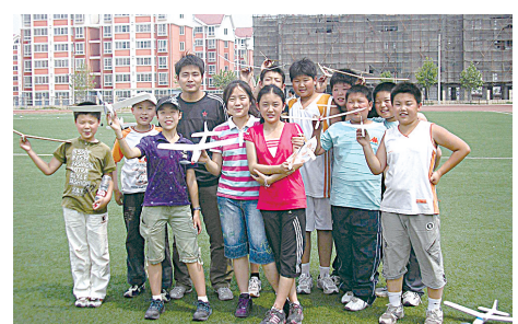
“我心飞翔”航模社团郊外试飞