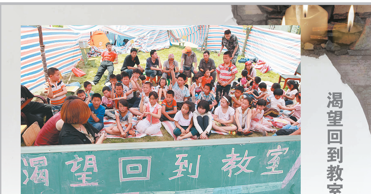
4月26日,孩子们在灵关中学临时帐篷中上课。当日,记者在宝兴县灵关镇灵关中学安置点看到,一群孩子在临时搭建的帐篷里上课,前面一块挡风的黑板上写着“渴望回到教室”。灵关中学教学楼在震中受损,目前除了一间多媒体教室还可以进入外,其他教室基本关闭。孩子们只能在帐篷和木板房中活动、玩耍。

彭博格说,据美国联邦调查局24日晚提供的消息,詹姆斯·察尔纳耶夫18日晚间企图在麻省理工学院校园抢劫一辆车,携炸弹从波士顿开车到纽约,然后在时报广场引爆炸弹。