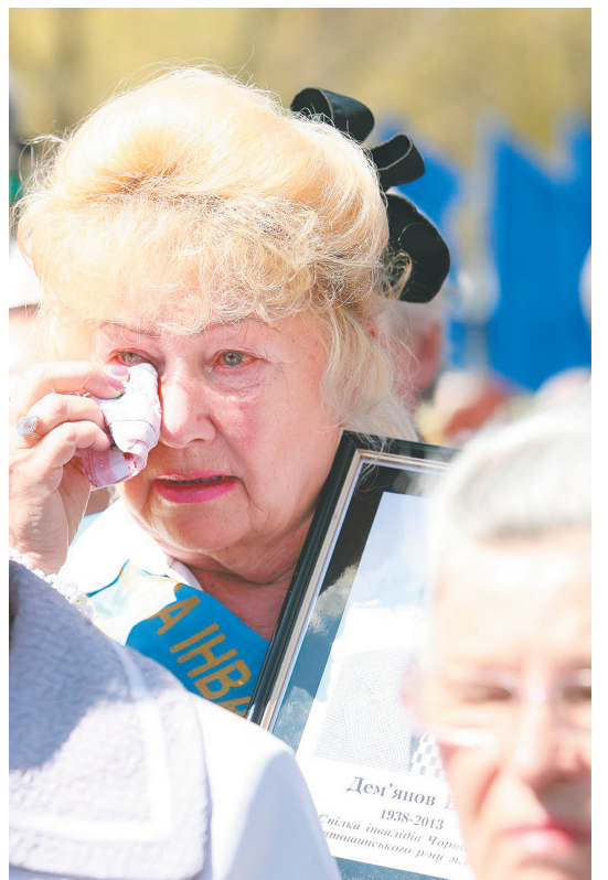
4月26日,在乌克兰首都基辅,一名乌克兰妇女在切尔诺贝利核事故纪念仪式上手捧亲人的遗照哭泣。

当日,乌克兰民众在首都基辅的切尔诺贝利核事故死难者纪念碑前举行活动,纪念切尔诺贝利核事故27周年。