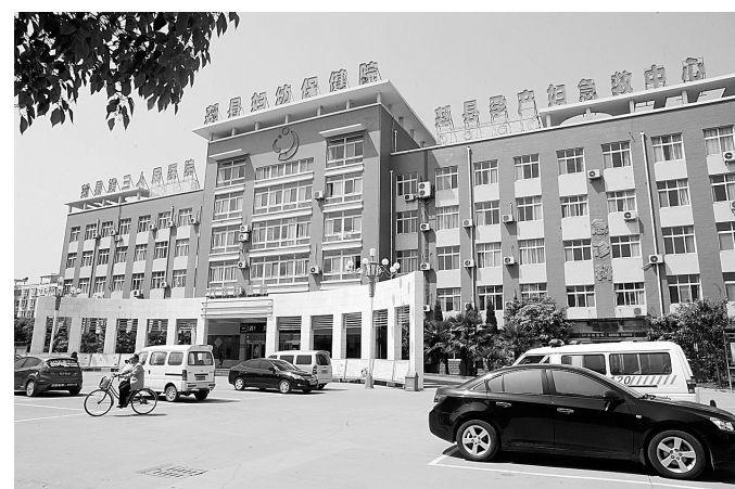
集聚区内新建医院

功夫不负有心人。两大龙头企业最终都决定落户郑县,这不仅为产业集聚区奠定了主导产业基础,也带来了一系列配套企业集聚发展,为郑县县域经济长远发展增添了后劲。