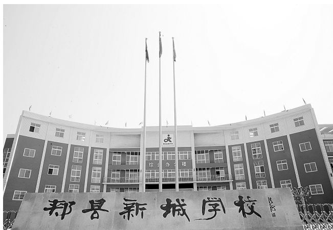
集聚区内新建学校