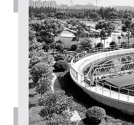
集聚区内的污水处理厂

圣光集团落户郑县后,通过医药物流公司打造“圣光医药战略联盟”,联合全省108个县(市)的医药经营单位,共同建立统一采购、统一价格、统一配送、统一结算的医药流通体系,在全省覆盖率达100%,在全省市场占有率达60%,有力提高了郑县的知名度。