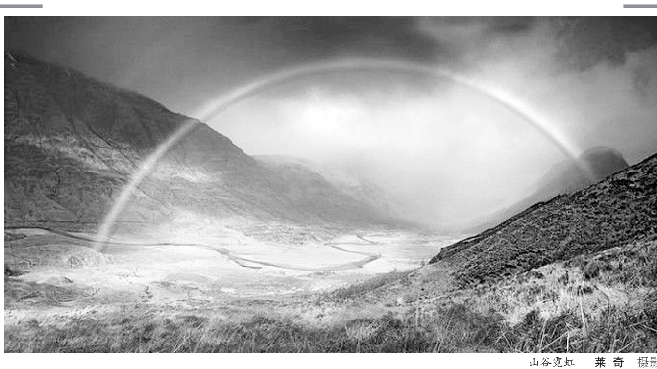
山谷霓虹

该村村民以曹、任两大姓居多,近200户千余人。十一届三中全会后,该村村办企业、个体经济发展迅速,很快成了远近闻名的小康村。特别是进入二十一世纪后,郑州市区向西发展,该村与市区连为一体,成为都市村庄。旧貌换新颜,这里楼房林立,鳞次栉比,村村村貌整齐划一,水泥路宽阔平坦,直通市区主干道建设路,多数村民有自家的汽车、摩托车,出行方便。该村又成为市66路公交车的终点站。由于交通便利,村民的空闲房屋也受到市区打工者的青睐。