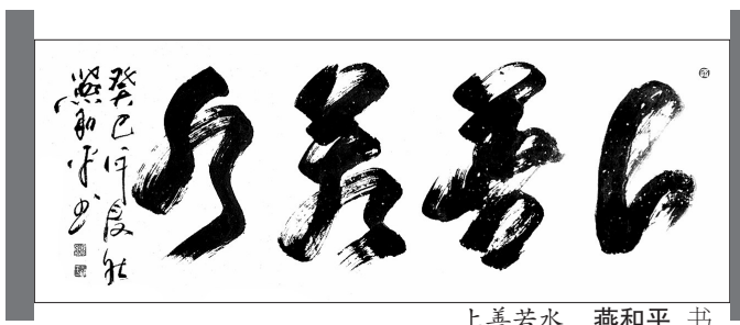
上善若水 燕和平 书

小说全面、真实地披露炒房中的种种圈套、陷阱，及政府与开发商之间的利益博弈，指导购房者如何规避开发商的陷阱，脱离炒房客和开发商的掌控。在房妹房姐房祖宗横行的时代，毫无特权的普通百姓如何在官商勾结的重重内幕之下，打赢买房这一战？本书为你一一道来。