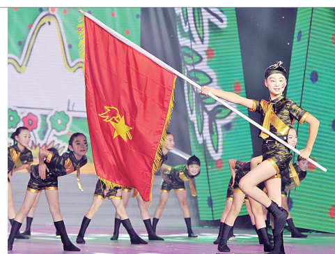
丰馨舞蹈社团表演舞蹈《少年先锋》

社团课程作为学校课程建设的重要组成部分,是学校文化建设的重要载体,是学生展示才华的舞台。学生社团课程的开发与实施,能够陶冶学生情操,启迪学生思维,张扬学生个性,全面提高学生综合素质。近年来,金水区丰产路小学坚持一手抓品牌社团,一手鼓励学生自主成立社团,努力完善社团课程,借助社团课程的均衡发展力促学生自主成长,丰羽亮翅。