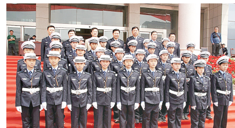
省有关部门领导和学校丰馨少年交警队员合影

“护绿小队”社团,以团长为核心,下设“知绿、爱绿、护绿、植绿”四个小队,分别负责对各班学生的知识讲解、标识语制作、浇水及植树等。循着校园漫步,你会看到他们制作的标识牌被深深地插入泥土里,显示出对保护校园绿色的坚定决心。“爱护花草、人人有责”等标识语以及关于树木名称、习性等知识的标识牌被制作成各种形状,挂在树上,迎风飘扬,像在对