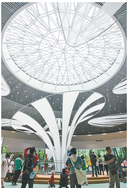
5月18日,游客在第九届中国(北京)国际园林博览会主展馆内参观。

当日,第九届中国(北京)国际园林博览会在位于北京市丰台区永定河畔的园博园开幕,本届园博会将持续至11月18日,游客将有机会领略中国69个城市和五大洲29个国家不同的园林风格。新华社发