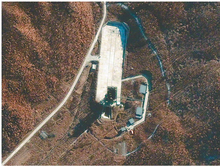
这张2012年11月23日拍摄的卫星图片显示的是位于朝鲜平安北道铁山郡的西海卫星发射场(资料照片)。

韩国国防部说,朝鲜18日发射三枚短程导弹,落入朝鲜半岛东部海域。韩国国防分析研究所解读美国五角大楼一份报告后推定,韩方低估朝鲜导弹能力,后者可能拥有200座可移动导弹发射架。