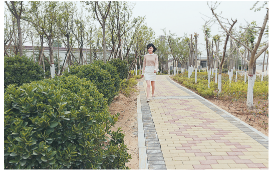
生态廊道环境优美