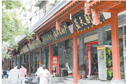
商都文化特色商业区