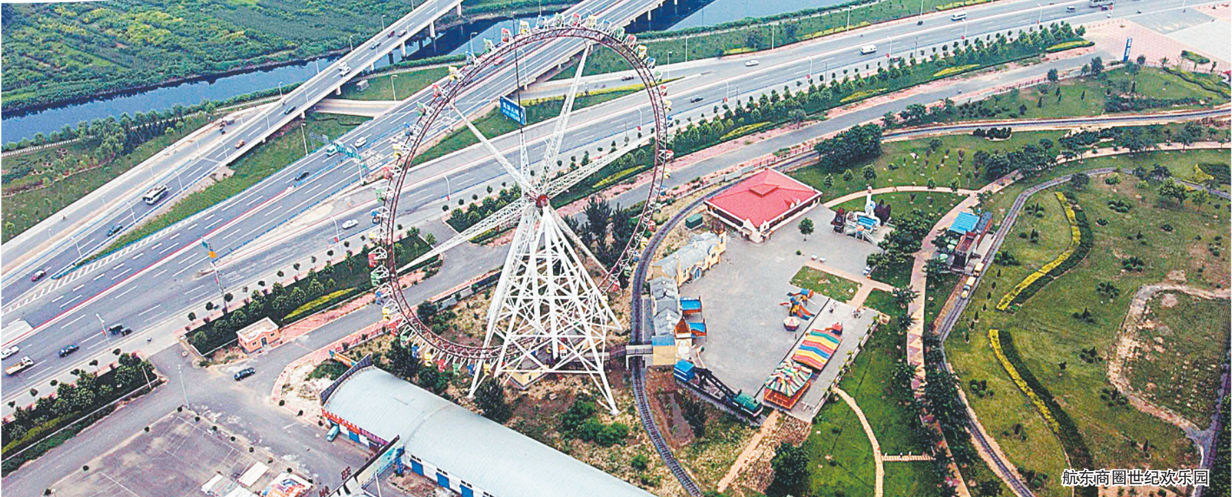
航东商圈世纪游乐园