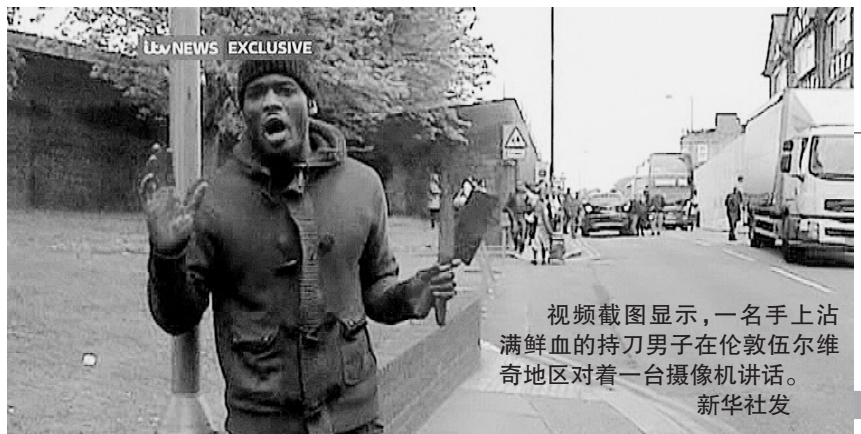
视频截图显示,一名手上沾满鲜血的持刀男子在伦敦伍尔维奇地区对着一台摄像机讲话。新华社发

这张拼版照片显示的是:5月22日晚,江西省都昌县上空一架飞机从月亮前飞过。新华社发