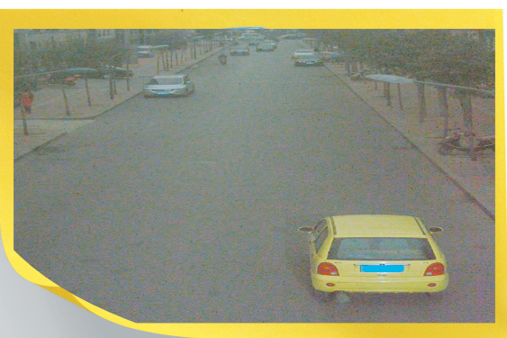
政四街经二路闯单行