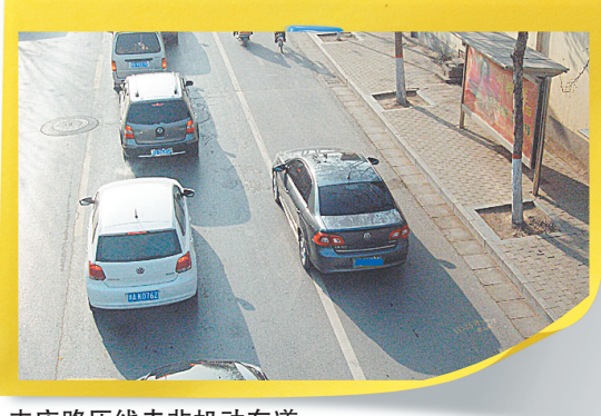
丰庆路压线走非机动车道

本报讯(记者 王娟 通讯员 孟繁勇 张克)“为什么自己在非故意的情况下被‘电子警察’拍到了好几次?”记者走访了解到,不少市民存在这种困惑。各种交通违法行为是如何造成的?怎样减少和规避再次违法?昨日,我市警方公布“防拍宝典”,提示交通参与者几类常见的交通违法行为及规避方法,以便市民更好地遵守交通规则。