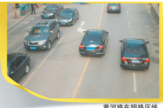
黄河路东明路压线