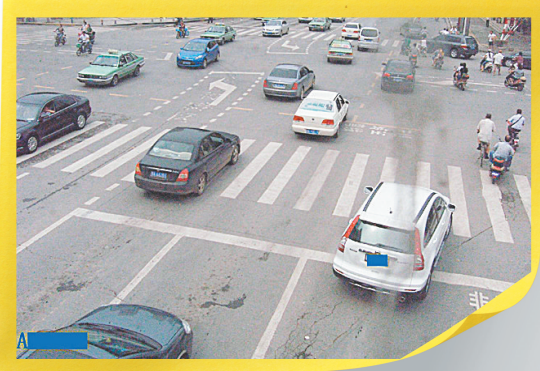
黄河路经三路右转弯闯红灯