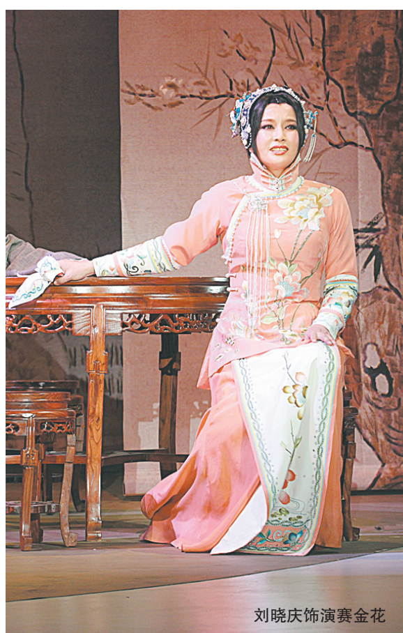
刘晓庆饰演赛金花

郑州市老干部合唱团始建于1986年，其成员主要来自全市离退休干部。成立27年来，该团不断发展壮大，是一个非常有力的百余人混声合唱团，在全省、全国老年合唱比赛及展演活动中多次获奖，并经常深入机关、部队、学校、村镇为基层群众演出，为丰富老干部文化生活、加强我市精神文明建设作出了贡献。