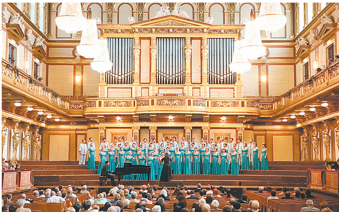
郑州市老干部合唱团在维也纳金色大厅演出

“公益无限”系列文化惠民活动是我省不断探索文化惠民方式，携手社会力量共同打造社会公共文化服务品牌的一次创新和实践。截至目前，已累计演出86场，使6万多名群众受益。5月22日、23日的演出由河南省文化厅主办、城乡小康发展河南中心联合河南省群众艺术馆承办。郑州市豫剧团、郑州市戏曲艺术学校以及河南公益无限艺术团近百位文艺工作者联合参加演出。