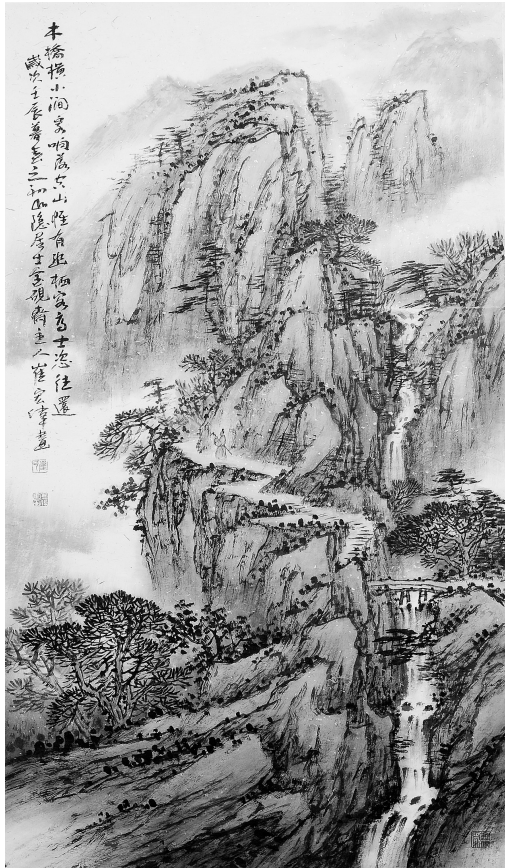
木桥横小涧(国画) 崔宏伟