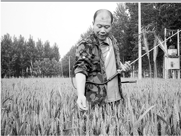
近日,发改委等六部门发布了《2013年小麦最低收购价执行预案》。根据该预案,白小麦、红小麦和混合小麦的最低收购价格均为每市斤1.12元。执行预案的小麦主产区为河北、江苏、安徽、山东、河南、湖北6省。最低收购价执行时间为2013年5月21日至9月30日。 图为河北省霸州市田各庄村村民在麦田里作业。

农贸市场蔬菜售价与前一周期相比,波动不大。 在工人路农贸市场监测的29种蔬菜中,仅6种出现价格波动,其中茄子、圆白菜等5种蔬菜价格下降,仅蒜薹1种上涨。批发环节蔬菜价格以下降为主。在河南万邦国际农产品物流股份有限公司监测到的27种蔬菜中,20种价格下降,其中莴笋价格下降最多,20日批发价格为0.8元/500克,24日已降至0.5元/500克,降幅为37.5%。