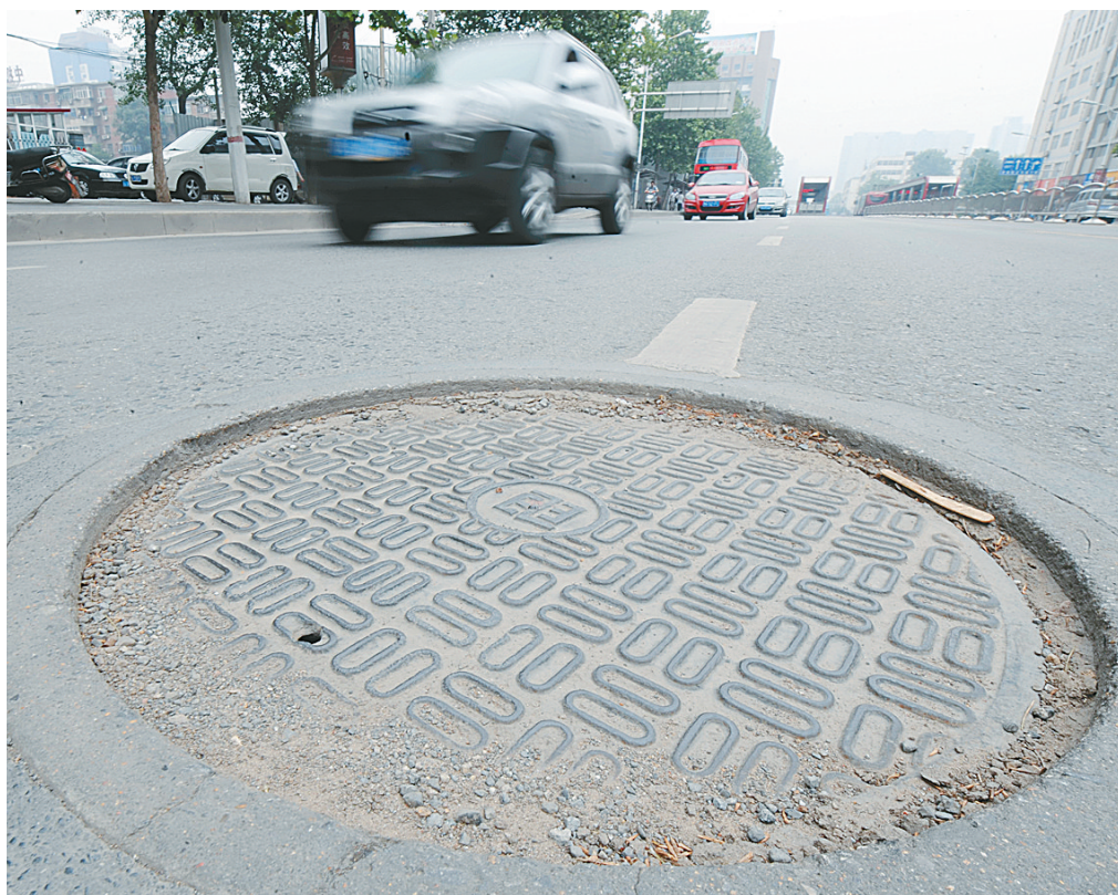
桐柏路快车道上的窞井盖低于地面约两厘米,给机动车行使带来很大安全隐患。

今年,我市多条道路工程集中开工,窞井盖管理压力更大,目前全市道路上有无窞井盖缺失、移位、开裂、突出凹陷等安全隐患?市民今夏能否安全度汛?昨日,本报记者兵分四路,提前为市民打探窞井盖管理现状。