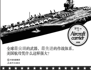
全球最先进的武器,最先进的作战体系,美国航母凭什么这样强大?

此后八年中,“星座”号七次参与对北越的空袭,由于出色表现,约翰逊总统在1968年访问了“星座”号,尼克松总统则授予“星座”号“部队奖”(Presidential Unit Citation)。越战中美军的首批王牌飞行员也诞生在“星座”号航母上(先后击落5架越南的米格战斗机)。后来它还得到“海军陆战队远征奖章”。1981年里根总统访问“星座”号,更是成为该舰辉煌历史的里程碑。里根送给“星座”号一面总统旗帜,并称“星座”号是美国的“旗舰”。