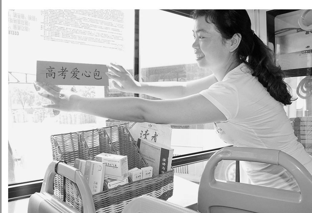
高考临近,公交二公司95路两位车长在车厢内设置了高考爱心包,内装风油精、藿香正气水、创可贴等药品,免费提供给考生和乘客。