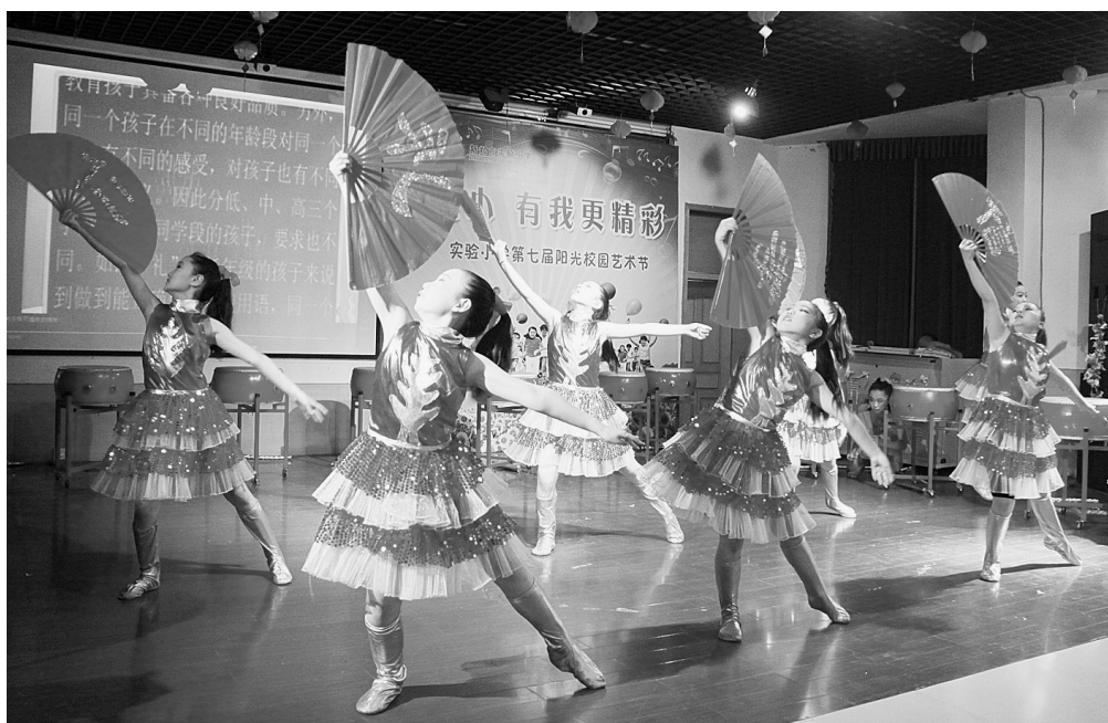
近日，新郑市实验小学第七届校园艺术节展演活动拉开序幕。据了解，本次艺术节活动历时一个月，共分为三大板块：读书成果汇报、文艺表演、艺术作品展览。全校三千多名学生全员参与其中，给孩子们搭建了自我展示的舞台，提供了展示艺术才能的空间。

本次活动赢得与会领导和学生家长的高度评价，学生也纷纷表示：这样的节日是他们的最爱！该届艺术节充分发掘学生潜能，助推学生个性特长发展，有力地营造出轻松、快乐、和谐、上进的节日氛围，为学生的健康成长起到助推作用。