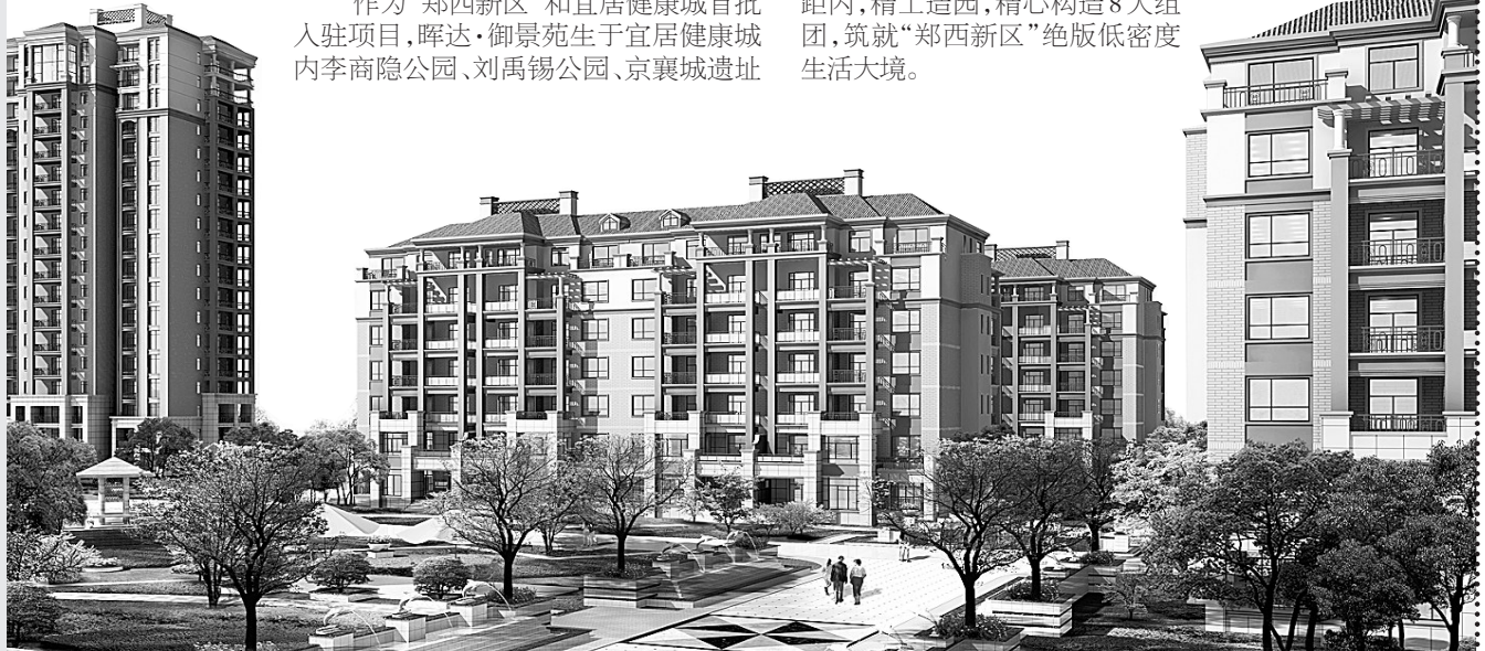
晖达·御景苑景观效果图

晖达·御景苑项目占地100余亩,一期总规划16栋楼,由7栋电梯花园洋房,9栋18层小高层组成。全城罕有的1.99超低容积率,成就了御景苑庄园级宽景园林,在土地资源极其稀缺的当下,项目将70%的土地让位于景观,并特邀国内知名专业园林设计机构倾情加盟,独创溪谷风情阔园体验,在宽达百米的楼间距内,精工造园,精心构造8大组团,筑就“郑西新区”绝佳低密度生活大境。