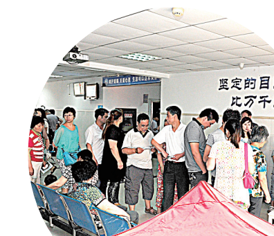
坚定的目光 比万千承诺

在科普宣讲点，医院不仅向市民提供健康咨询，免费发放健康手册，赠送了制作精美的爱心透视镜，还提供免费测视力、裂隙灯检查、眼底检查、测眼压、测量血压等。同时，该院还将6月定为“爱眼月”。凡“爱眼月”期间预约全飞秒激光手术的近视患者，均可享受3000元的健康补贴。