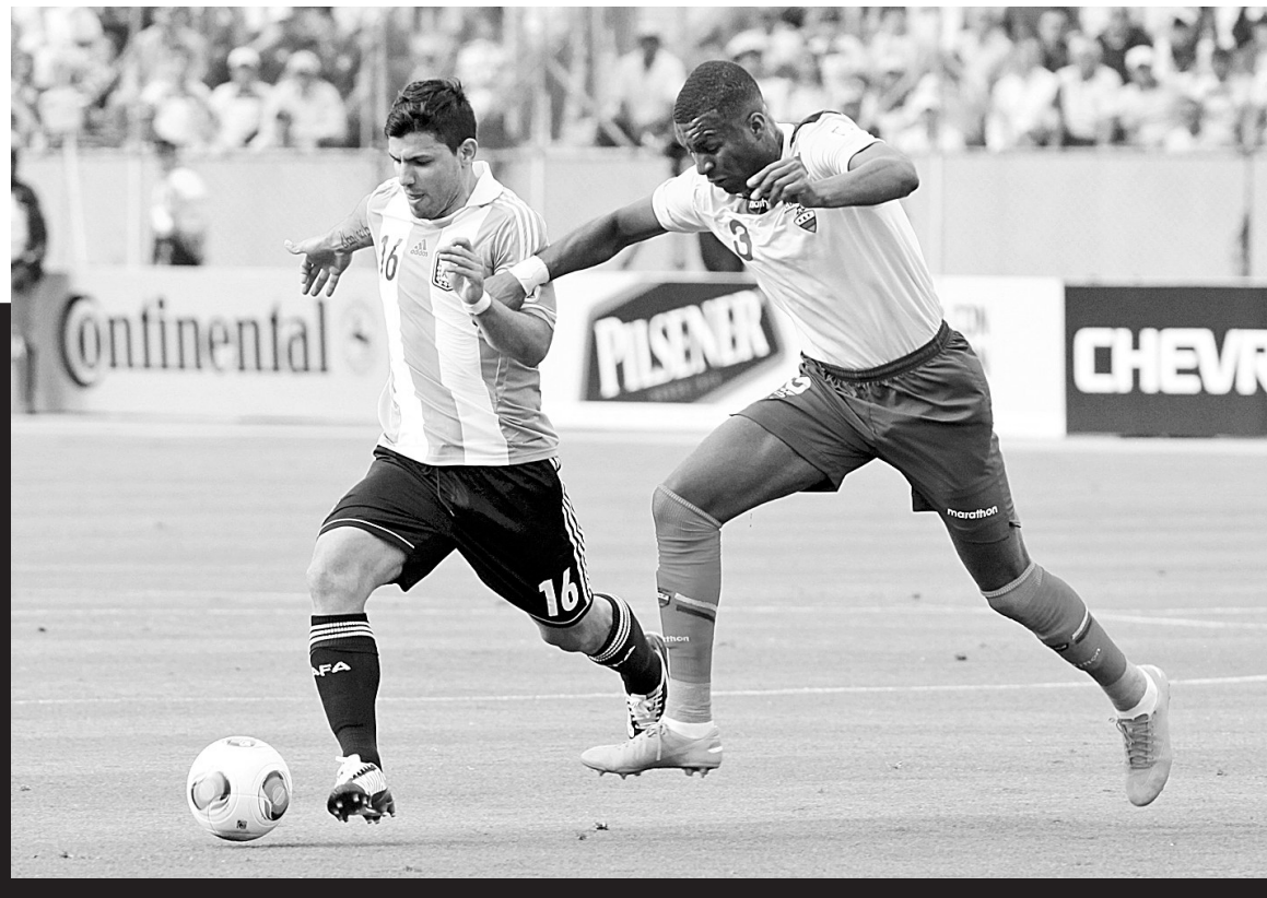
6月11日,阿根廷队球员阿奎罗(左)带球进攻。当日,在2014巴西世界杯南美区预选赛中,阿根廷队客场以1:1战平厄瓜多尔队。

自1985年总决赛使用2-3-2赛制以来,前两场比赛中双方战成1:1的情况已经出现了13次,凡是赢得第三场的球队,有12支笑到了最后,有意思的是,唯一一次失手的正是2010-2011赛季的热火队。马刺队昨天抢下“准天王山”之战,手握高达92.3%夺冠概率,相信这支以老辣著称的球队不会重蹈热火覆辙。如果你认为马刺昨天赢在了加里·尼尔和丹尼·格林两个角色球员的神奇三分上,那就大错特错了,他们的爆发只是一种表现,而邓肯、吉诺比利和帕克的稳健才是给热火以巨大杀伤的真正利器。本报记者 陈凯