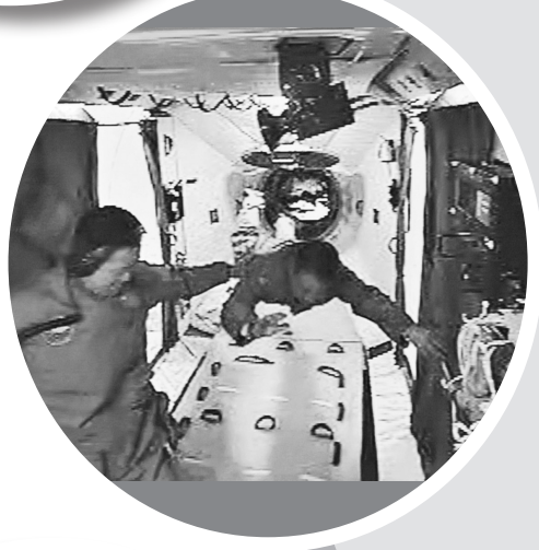
航天员聂海胜(左)在天宫一号舱内,辅助张晓光(右)进舱后站立。