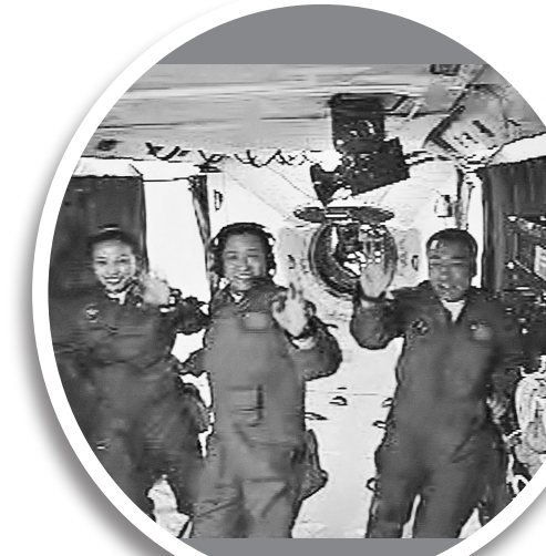
3名航天员在天宫一号向地面科研人员挥手致意。