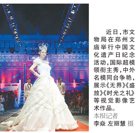
近日,市文物局在郑州文庙举行中国文化遗产日纪念活动,国际超模领衔走秀,中外名模同台争艳,展示《无界》《绽放》《时光之礼》等视觉影像艺术作品。本报记者 李焱 左丽慧 摄

打动了中国国少队的教练,将其招致麾下。又讯(记者 刘超峰)刚刚过去的端午节3天假期中,建业青少年足球训练营分别在郑州航海体育场、郑州春晖小学、郑州二砂实验小学举办了4期训练营。其间,建业退役名将聂磊、朱亮也来到沟赵中心小学和郑州市第58中学指导小学生足球训练课,两位专业教练精湛的足球技术和多样化的教学方法让小队员们大开眼界。