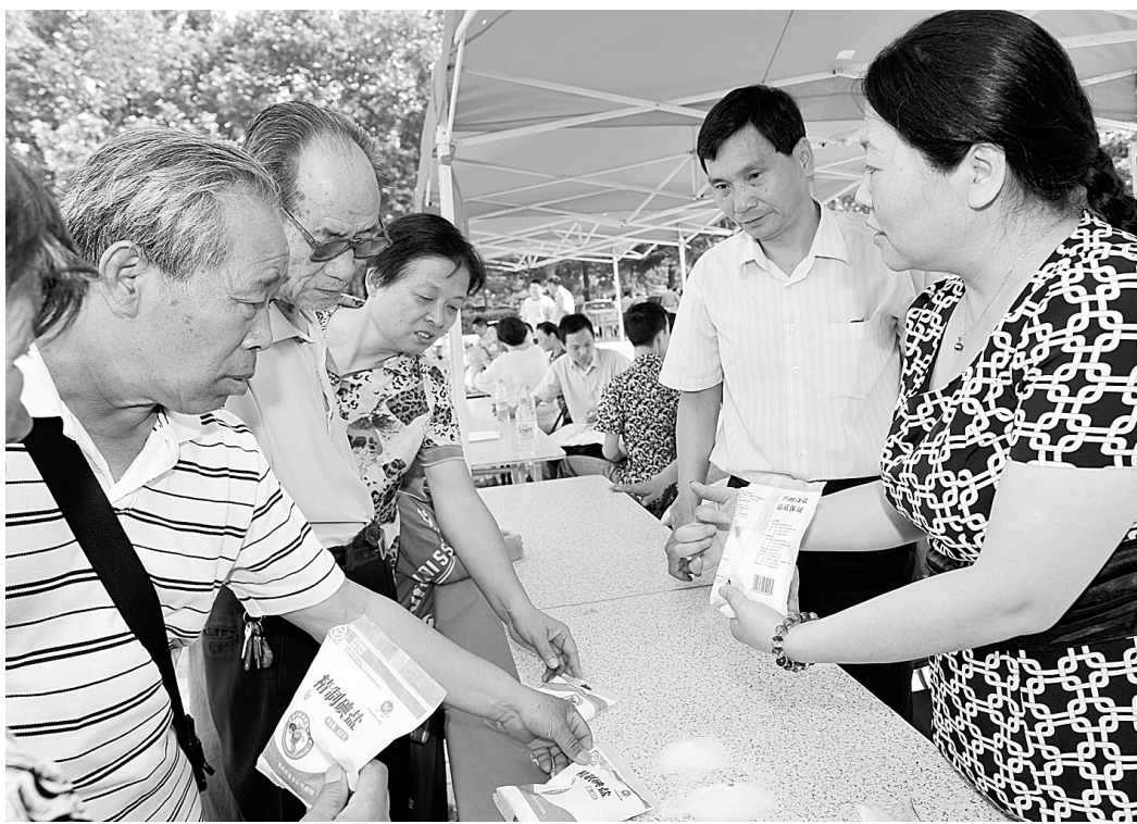
昨日,我市在绿城广场开展“法制宣传日”活动。图为市盐业局工作人员现场教市民辨别真假食盐,并向市民免费发放试剂。本报记者 丁友明 摄

此次活动共吸引居民近3000人,发放各类宣传材料2000余份,接待群众咨询200多人次。(吴兆波)