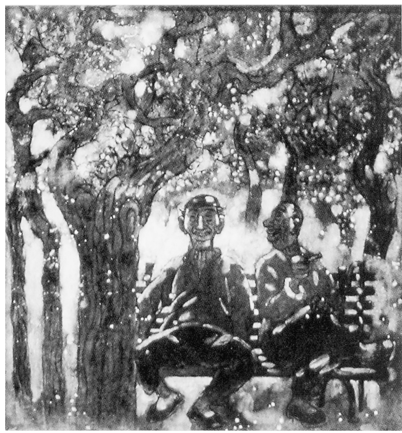
榆钱花开(国画) 郑光辉

阴书又进了一步,使用起来更加机密。其方法是把一份完整的军事文书裁成三份,分写在三枚竹筒上,然后派三名通信员各持一枚竹筒,分别在不同时间出发。到达目的地后,将三枚竹筒合而为一,其文书内容全面呈现出来。这种通信方法简称为“一合而再离,三发而一知”法。中途即使其中一人或两人被敌方捕获,也不致于泄密。