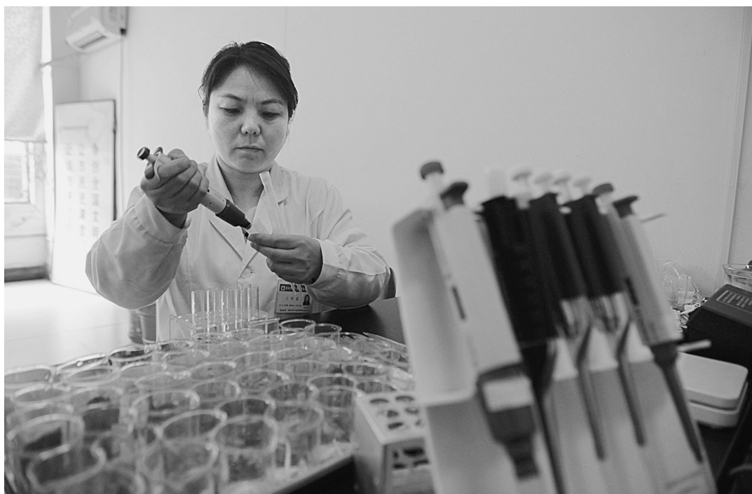
昨日,记者在嵩山路农贸市场看到,农产品安全检测员正在对当天抽检的蔬菜进行农药残留检测。据了解,我市已建立了以市农产品质量检测流通中心为龙头,县(市、区)检测中心和生产经营企业质量安全检测室为基础的“两级三层”检验检测体系。通过层层把关,确保百姓吃上放心菜。

通过座谈、参观、学习,双方就省会郑州传媒市场的发展达成共识:良性有序的竞争有利于传媒发展,媒体要“小竞争大合作”,只有这样才能最终实现双赢。双方还初步达成了一些合作意向。