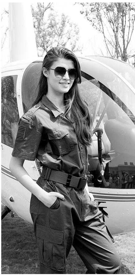
私人飞机展引人注目

本报讯(记者 刘文良)6月15日,万众期待的康桥九溪郡盛大开园,活动现场气氛火热、人流不息。实景花海绽放,私人飞机展、欧式风情街、特色互动DIY等节目,上演一派“红透六月”的望族盛宴。首次公开的景观示范区,更是让来宾大开眼界,赞叹不已。