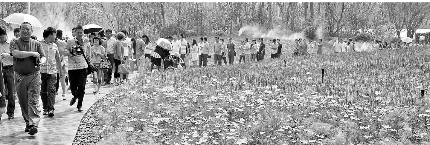
缤纷美景让人驻足流连

除了精彩纷呈的节目,主办方康桥地产还在现场为大家准备了精美茶歇,众多城市名门或相邀品茗、或共议开园。他们流连于醉人的景致和回家般惬意的美好时光,意犹未尽,不舍离去。