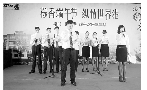
共庆端午 宾朋满座欢聚丽宫

每年农历五月初五的端午节,作为中国极其重要的传统节日之一,也是阖家欢乐的重要时刻。裕鸿·世界港为感谢新老业主长期以来的支持与信赖,特在今年端午节精心筹备了“粽香端午节 纵情世界港”端午欢乐嘉年华活动,以精彩的创意节目表演、趣味十足的互动游戏以及惊喜连连的抽奖等环节,带给广大新老业主一个不一样的端午假期。