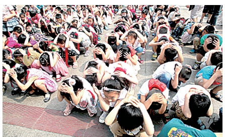
经三路小学开展防震减灾演练活动