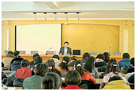
教体局春节廉政谈话会

近年来，金水区教育体育局以“办人民满意的教育”为目标，以服务师生、服务金水、服务社会为宗旨，大力加强教育系统廉政文化建设，细化安全管理，净化育人环境，全面构建和谐校园。