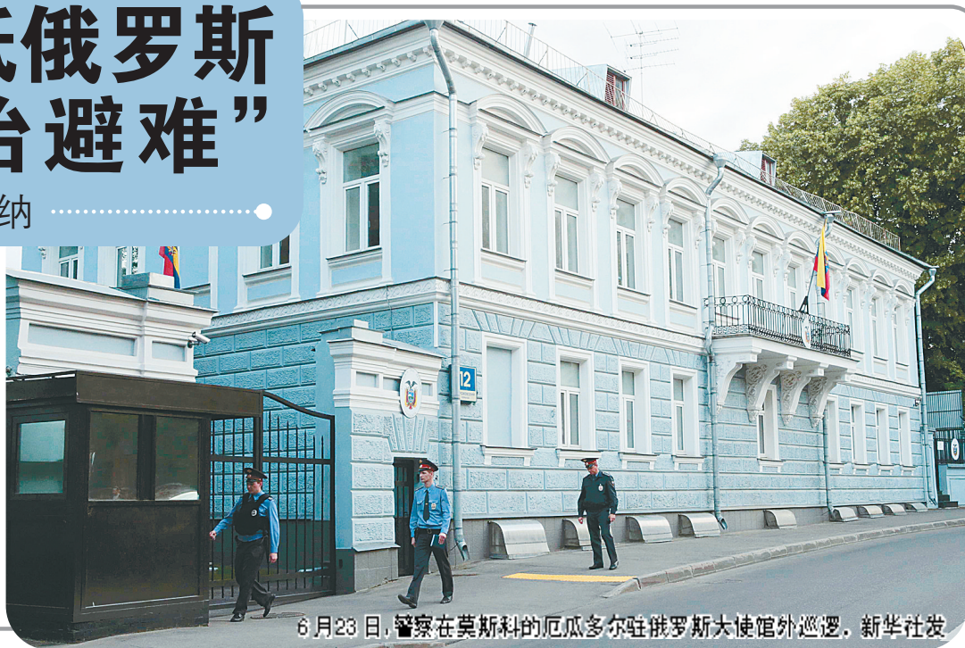
6月23日，警察在莫斯科的厄瓜多尔驻俄罗斯大使馆外巡逻。新华社发

同一天，美国要求俄罗斯政府协助遣返斯诺登。“维基揭秘”网站证实，“维基揭秘”法律顾问全程陪同斯诺登离境，已经帮助他获得“一个民主国家的政治避难权”。