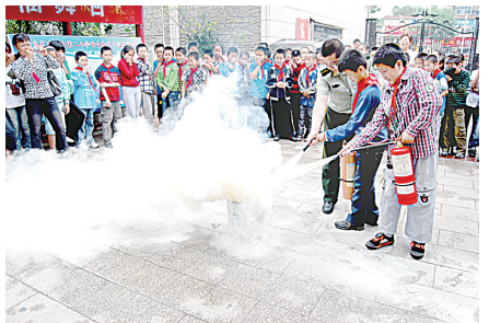
南阳路二小师生在消防支队警官指导下进行消防演练

四是取得显著成绩。上年度，金水区柳林七小荣获省消防安全示范学校，文一、优胜荣获防震减灾示范学校，教体局荣获市普法依法治理先进单位和省级“一打两整治”先进单位。