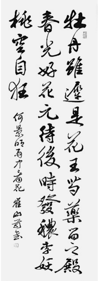
牡丹虽迟是花王(书法) 崔向前