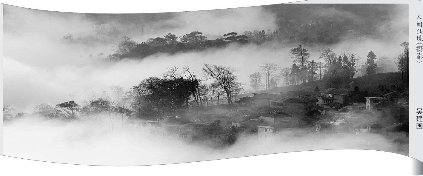
人间仙境(摄影) 吴建国

没有了大树,我再没见到刘睿他们。无聊时,我总是站在新家封闭的阳台上,一栋栋高耸入云的高楼早就阻隔了向外眺望的视线,我看着,想着自由自在的乡下,心头又开始不自觉地孤单起来。