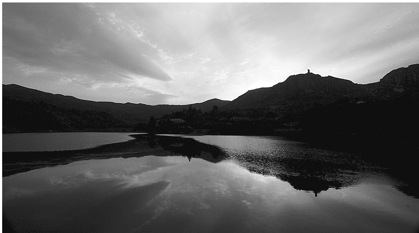
具茨山青岗庙水库

握住一分钟的疼痛 我把往事 丢进摇晃的风里 不管你的目光 有多少无奈 我一定要重新站起 站起来后的坚定 会让你我的心 充满青春的活力 过去的所有 不必用伤心来演绎 淡淡的一个微笑 便成为永久的美丽 你我的孤独 只是一个出口 当生命找到了温暖 时光就会羽化 心就会释放超人的热力 走过记忆 相爱的两颗心 就是一对永生的连理