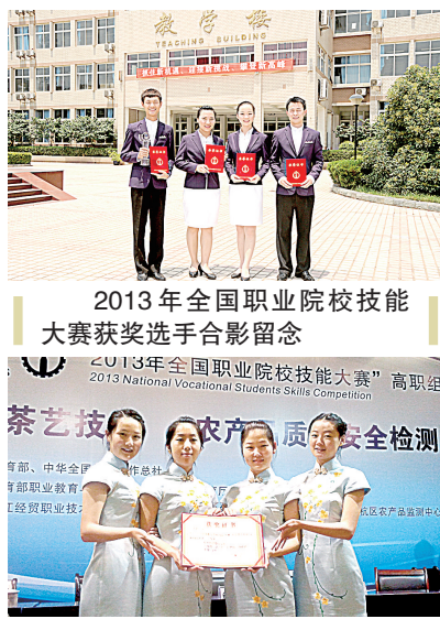
2013年全国职业院校技能大赛获奖选手合影留念