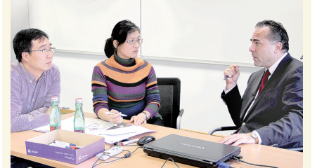
奥地利专家指导课题研究