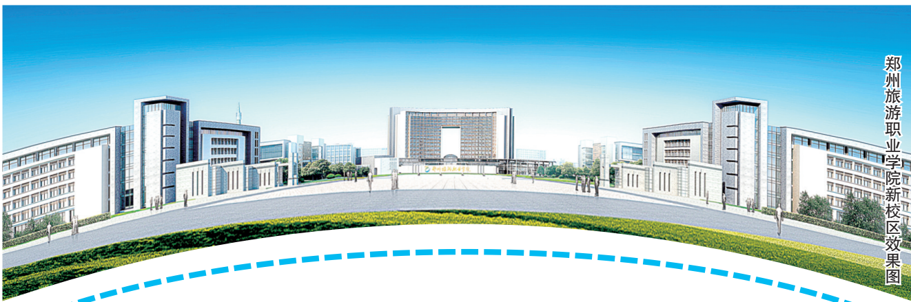
郑州旅游职业学院新校区效果图

这里是我省唯一培养旅游业专门人才的公办高等院校;这里被称为河南旅游业的“黄埔军校”;这里培养的学生遍布祖国大江南北,撑起旅游业的“钢铁脊梁”;这里正在上演一幕幕从开拓创新一务实重做一放飞梦想的恢弘“连续剧”,万名师生凝聚的巨大合力推动着这个河南“旅游人才航母”在激烈竞争中勇往直前,破浪前行!