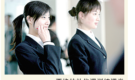
严格的礼仪课训练课堂