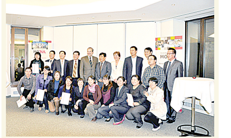
该院老师赴奥地利培训结束后与中国驻奥地利大使馆教育参赞合影