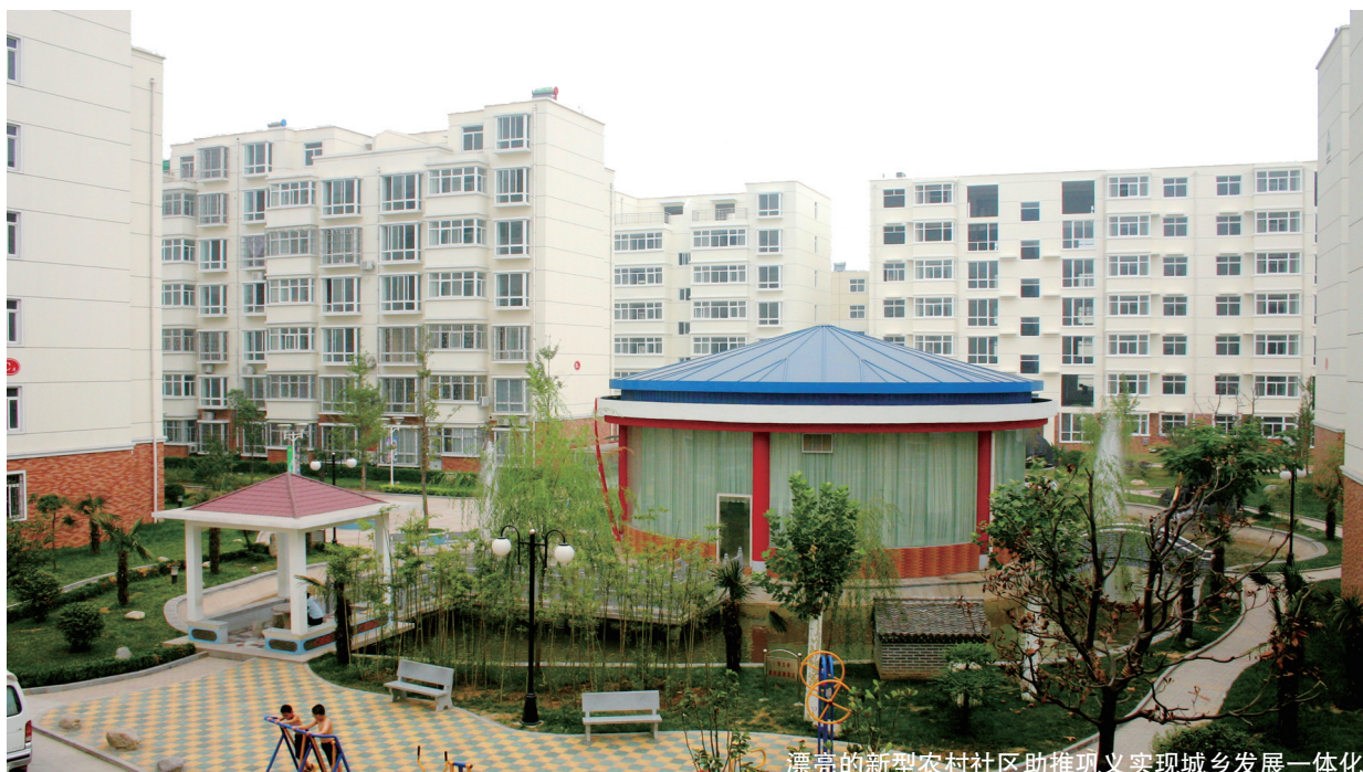
漂亮的新型农村社区助推巩义实现城乡发展一体化

如今,巩义城乡正沿着“三化”协调、“四化”同步科学发展的道路大胆实践和探索,这种实践凝聚着巩义广大干部群众的决心和信心,这种探索倾注了81万巩义人民的殷殷期盼。潮平两岸阔,风正一帆悬。这种充满务实精神的实践探索,必将进一步推动巩义提速发展阔步前行!