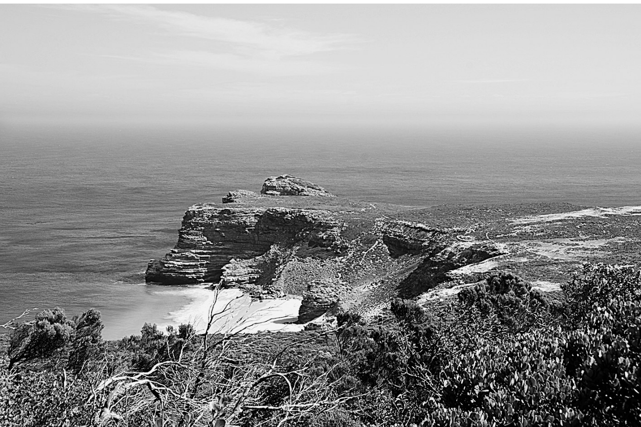
好望角风光

最近，我回了一趟老家。虽然父亲早已驾鹤西去，我们兄弟姊妹们也都先后离开了小院，但那棵饱经沧桑的石榴树依然在小院里顽强地坚守着。开的花还是那样红，结的子还是那样甜。此时，来了一位我小时候的“闰土”和他的妻子——当年留下来的那位女知青。我拉住他们的手，双眼对四眸，十分动情，脑子里蓦然闪出四个字：赤子之心！