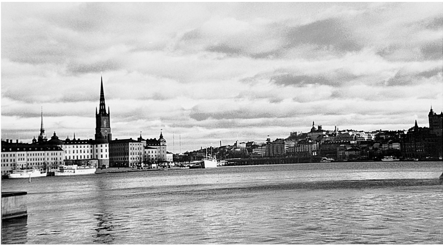
荷兰风光

那首被作为诗集书名的小诗《竹子在雨中醒来》，就很恰当而浓缩地描述了旭旺先生的精神经历。我们可以把这棵被赋予象征意义的竹子看作是旭旺先生内心的寄托。它经历了漫长的睡去终于“醒来”，并且在“雨后的真实存在”中选择了“拔节的程序”。我们可以想象这个拔节的程序所包容的社会程序、人生程序以及内心成长的精神程序等等更宽泛的内容。但终于有了“绿的站立”，这就是旭旺先生在醒来后对世界的回答，也是其最终达成自