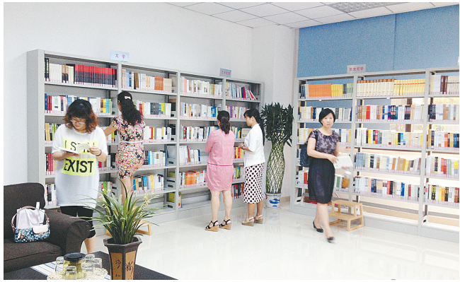
中原区图书馆借阅便捷很受欢迎

本报讯 为了更好地给机关干部提供优质文化服务，中原区在区机关大院设立了中原区图书馆机关分馆。7月8日，该馆正式运行。