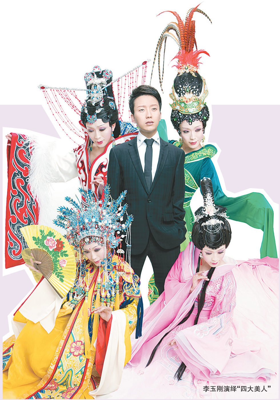
李玉刚演绎“四大美人”

作者王臣曾先后被《亚洲周刊》等多家媒体报道，其作品一经出版就陆续登上各大畅销榜，已出版的作品有长篇小说《浮光》《抵年》；散文集《最远的旅行，是从自己的身体到自己的心》；私享笔记·系列《谁念西风独自凉》《世间最美的情郎：仓央嘉措传》《世间最美的情郎2》《喜欢你是寂静的》《今生就这样开始》《孤独是心的猎手》等。