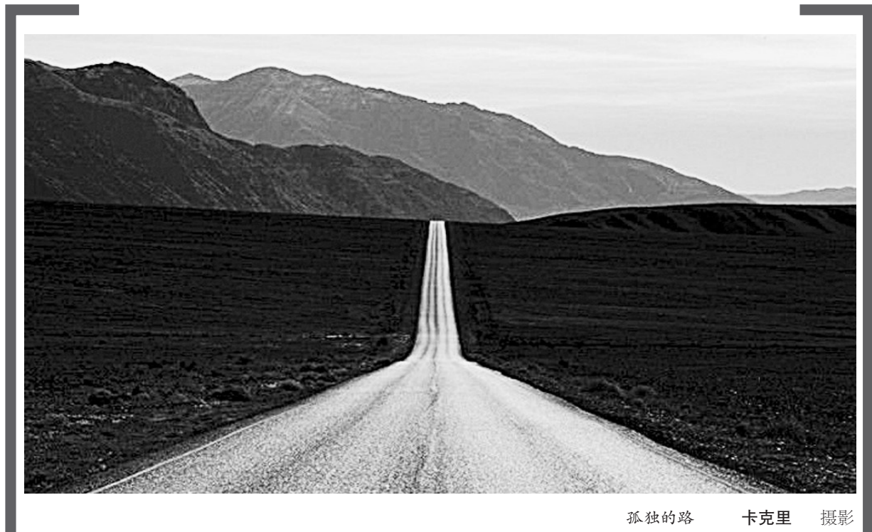
孤独的路

我也确信,我们都身在美轮美奂的小诗人群体之中,只要我们言说着自己的生活、生活的意义,也恰如那条河流本身。