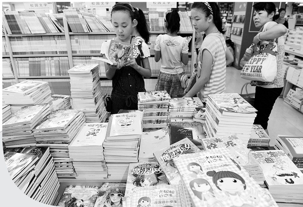
书店看书,“充电”纳凉两不误。

市内各家游泳场馆也迎来火爆人气。动辄数百乃至上千元的会员卡销售火热,进入暑假以来,游泳卡的销量明显上升,这也是一年中游泳中心生意最好的时候。