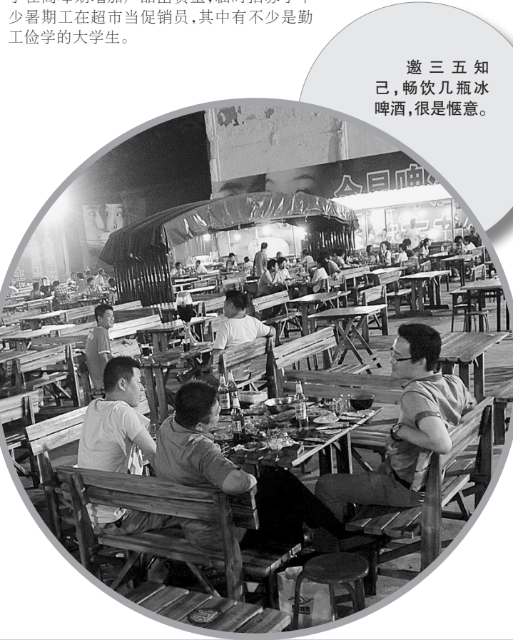
邀三五知己,畅饮几瓶冰啤酒,很是惬意。