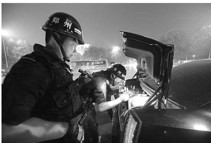
昨晚,在市公安局的统一部署下,特警支队紧急出动精干警力,在市区的各主干道及重点部位分别开展武装震慑车巡和武装守护步巡,集中打击夏季侵犯犯罪专项活动。