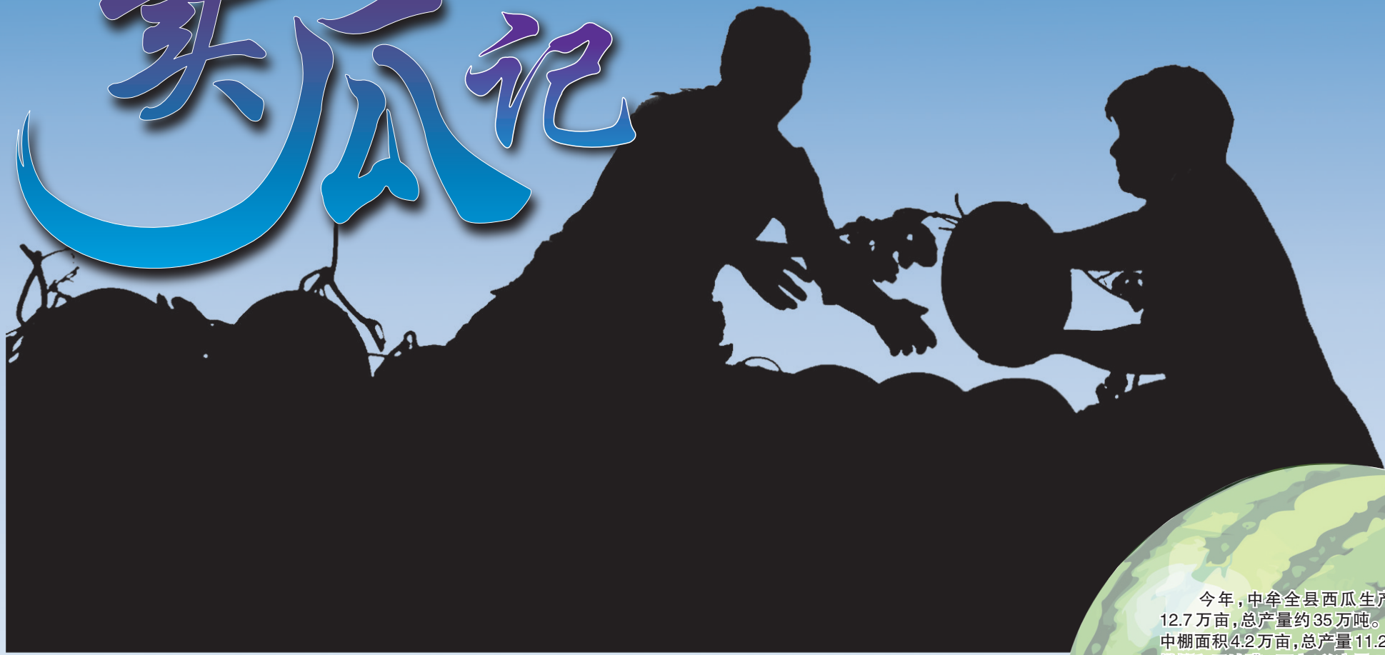
凌晨5点,两口子开始忙活起来。