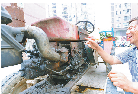
小四轮漏油了,老仓心里开始打鼓。