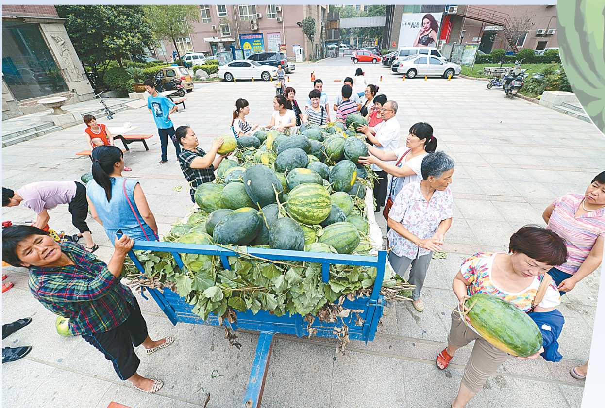
▲看着西瓜一个个被买走,老仓两口心里像西瓜一样甜。