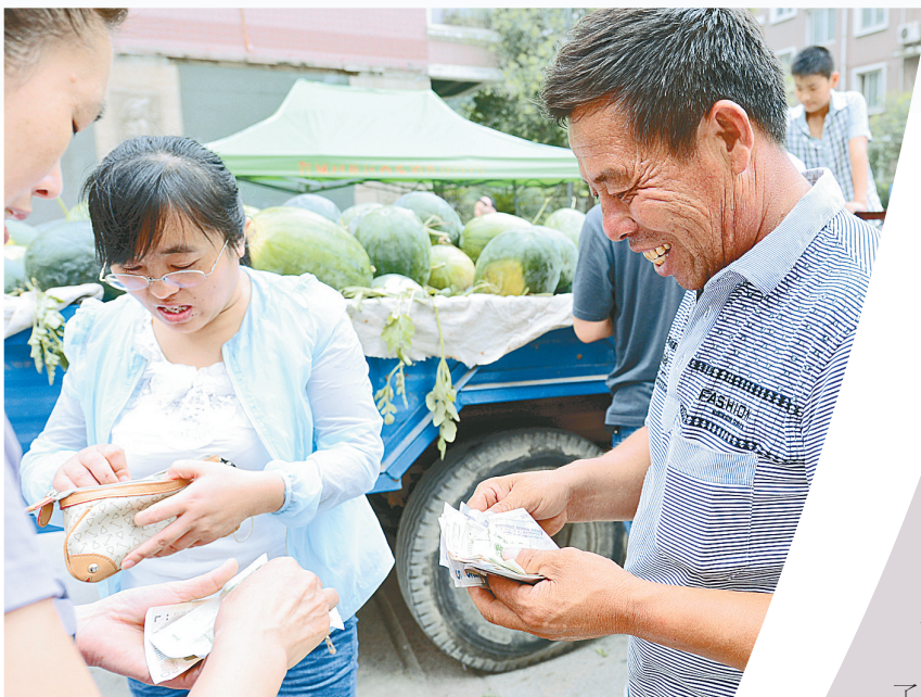
▶瓜一下子卖出去了不少,数着手里的把钱,老仓笑得满脸皱纹。