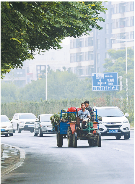
瓜车开进了市区,老仓心里一直忐忑不安。