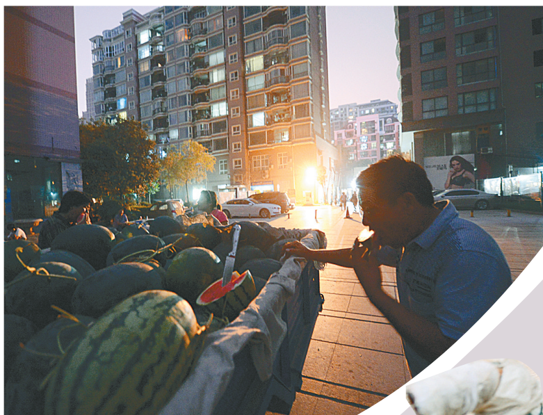
还有大半车的瓜没卖出去,老伴无心吃饭,老仓干脆以瓜充饥。