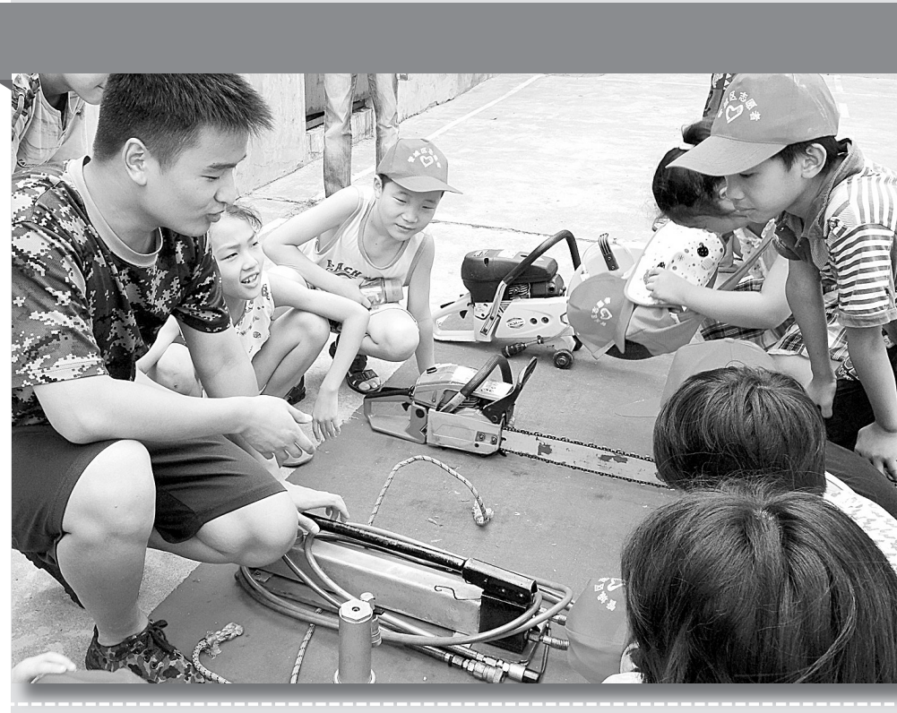
近日,管城区西大街街道平等街社区联合管城区文明市民爱心热线开展暑期青少年夏令营“平安假期,快乐生活”主题教育活动。社区组织青少年参观消防军营,邀请消防官兵进社区开展青少年暑期安全知识讲座,并组织青少年参加安全教育实践活动。

堂称号的学校。省教育厅将对10月份复查结果进行通报,对本次复查达不到“一级食堂”标准的学校将进行警告,并限期整改。整改后仍达不到标准的将取消“一级食堂”称号,省级示范性高中达不到标准将取消“省级示范性高中”称号。