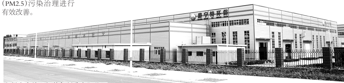
郑州康宁特环保装备制造有限公司