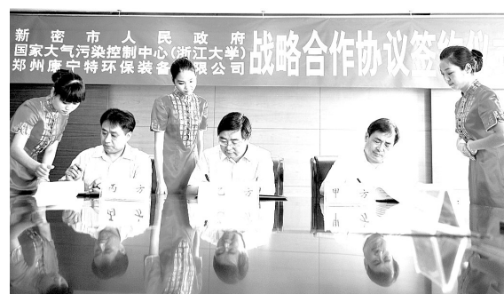
新密市政府、国家环境保护燃煤大气污染控制工程技术中心(浙江大学)、郑州康宁特装备制造有限公司战略合作协议签约仪式现场

新密市产业集聚区为发展环保装备产业提供载体和平台,浙江大学环保科技产业园、郑州环保装备产业园在新密市产业集聚区落户,使新密市产业集聚区特色产业更加突出。新密市产业集聚区是河南省级产业集聚区,规划面积13.35平方公里,主导产业为服装生产和装备制造,其中环保装备制造产业是集聚区重点发展产业。