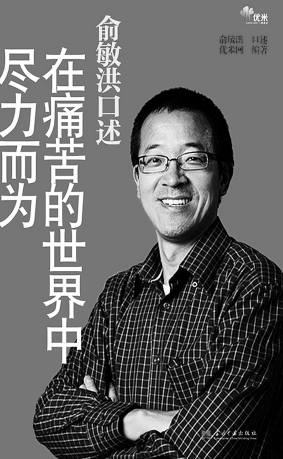
俞敬进口述 在痛苦的世界中 尽力而为