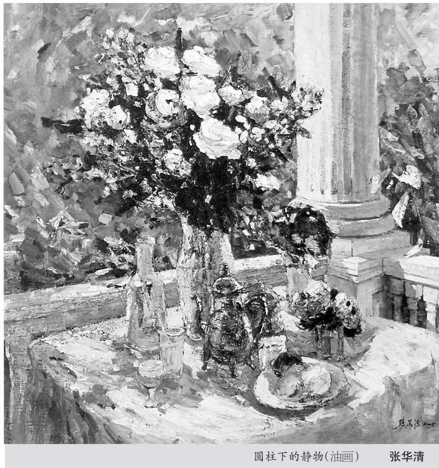
圆柱下的静物(油画) 张华清