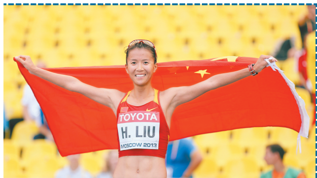
8月13日,刘虹在比赛后庆祝。当日,在2013国际田联世界田径锦标赛女子20公里竞走决赛中,中国选手刘虹以1小时28分10秒的成绩获得季军。

教练员和运动员将统一着装出现在领奖台以及全运会各个赛场。据了解,这套漂亮的服装由特步公司设计制作,通体为红白搭配金色,色彩绚烂,尤为特别的是,衣服上还印有漂亮的牡丹花,凸显河南元素,新装模特、女篮运动员潘丽告诉记者,本届全运会服装跟以前的相比,牡丹的设计确实别具匠心,而且时尚,穿上舒服,很有美感。